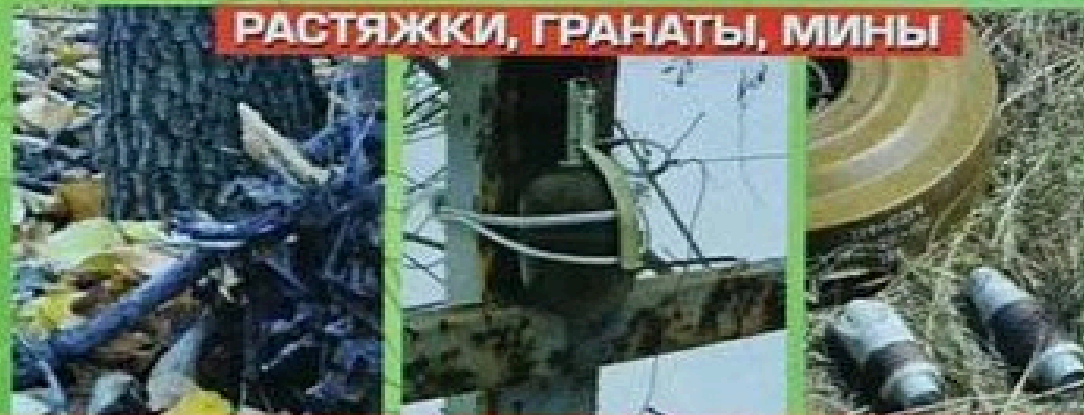
РАСТЯЖКИ, ГРАНАТЫ, МИНЫ