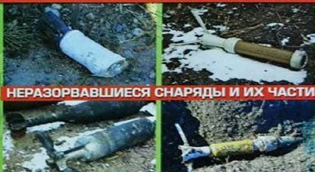
НЕРАЗОРВАВШИЕСЯ СНАРЯДЫ И ИХ ЧАСТИ