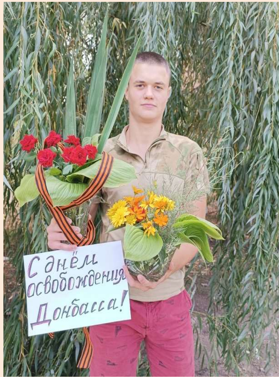
49 группа СП