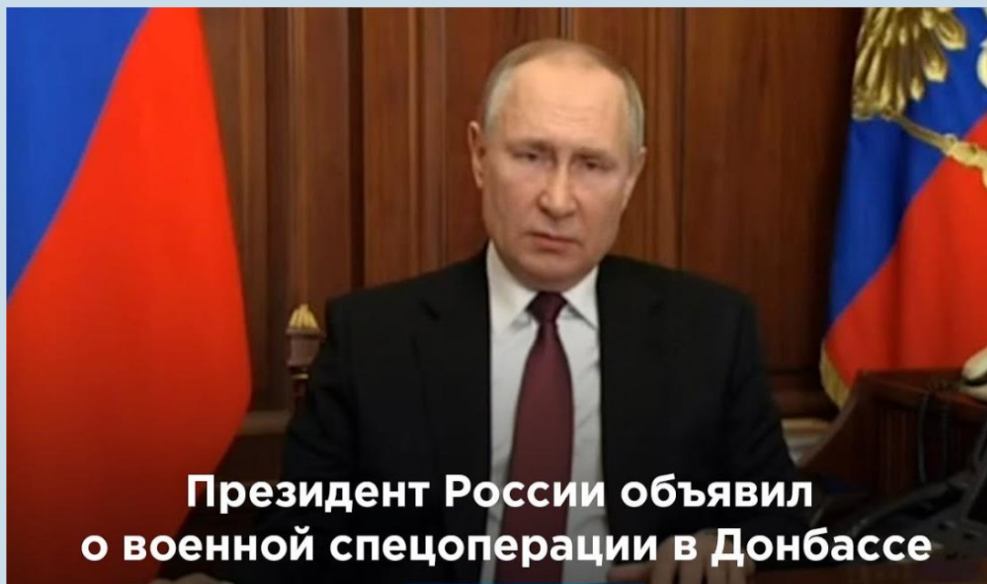
Президент России объявил о военной спецоперации в Донбассе

24 февраля 2022 года президент России Владимир Путин объявил о начале специальной военной операции на Донбассе. Буквально за неделю Вооружённым силам РФ, а также армейским подразделениям Донецкой и Луганской народных республик удалось добиться значительного продвижения по территории Украины, освободить несколько крупных населённых пунктов, блокировать силы ВСУ и нацистских формирований вокруг основных центров и локализовать угрозу прорыва украинской армии. Все развитие операции было основано на стремлении сохранить жизни мирного населения и избежать ненужных разрушений.