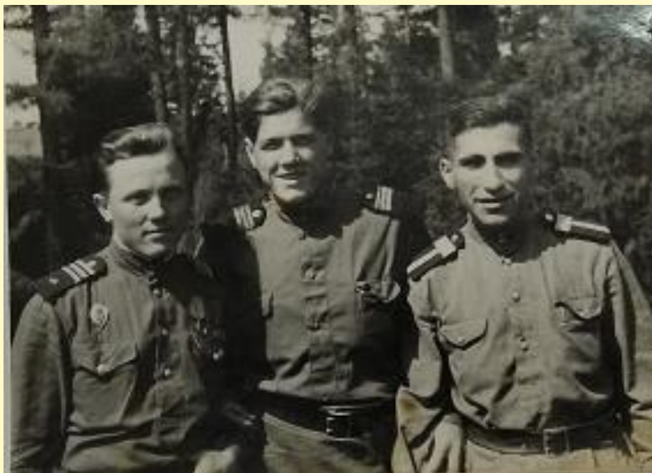
Венский лес. Задера А.К