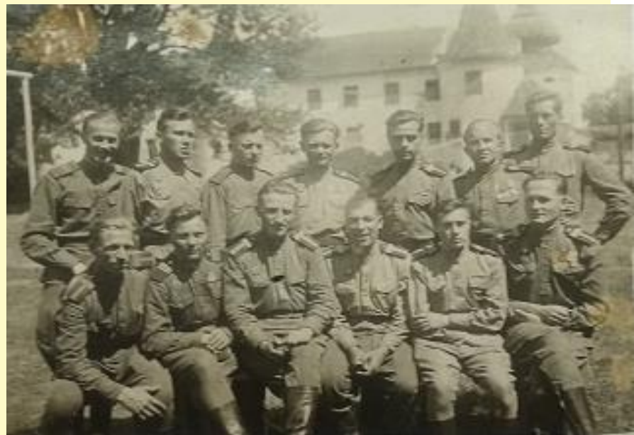
Окончание войны. Берлин 1945 г.