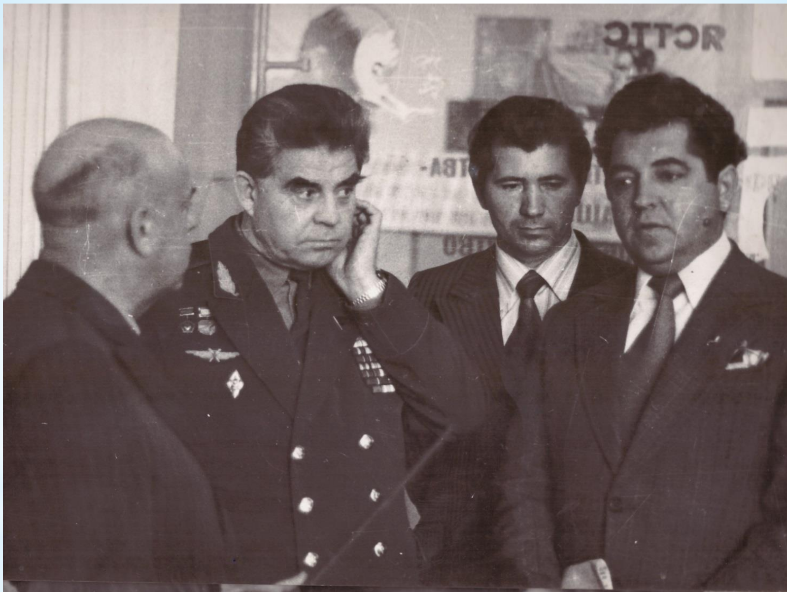
Г.Т.Береговой посещает выставку технического творчества студентов ЯСТТС.