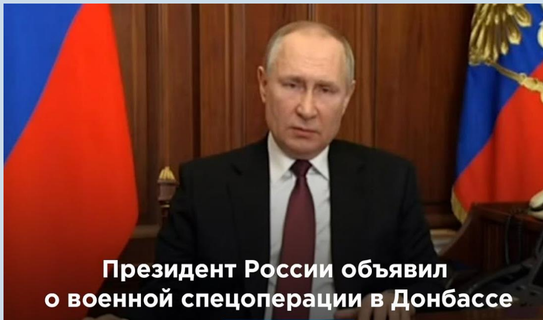
Президент России объявил о военной спецоперации в Донбассе

24 февраля 2022 года президент России Владимир Путин объявил о начале специальной военной операции на Донбассе. Буквально за неделю Вооружённым силам РФ, а также армейским подразделениям Донецкой и Луганской народных республик удалось добиться значительного продвижения по территории Украины, освободить несколько крупных населённых пунктов, блокировать силы ВСУ и нацистских формирований вокруг основных центров и локализовать угрозу прорыва украинской армии. Все развитие операции было основано на стремлении сохранить жизни мирного населения и избежать ненужных разрушений.